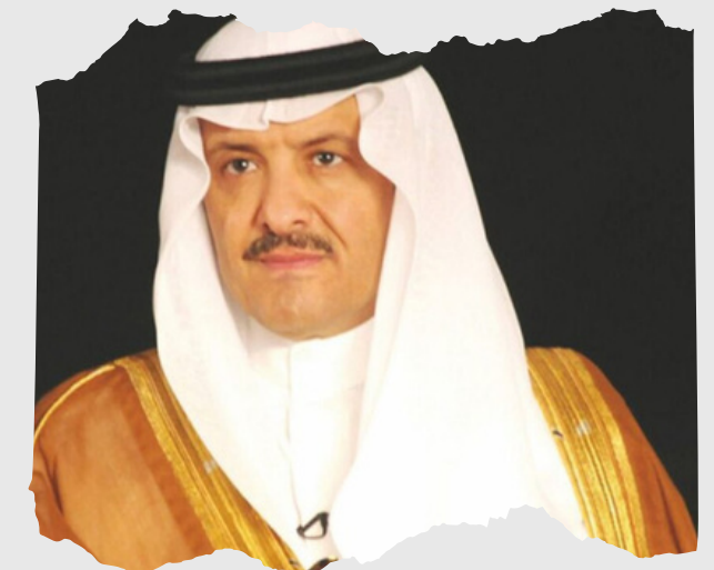
صاحب السمو الملكي الأمير سلطان بن سلمان بن عبدالعزيز آل سعود