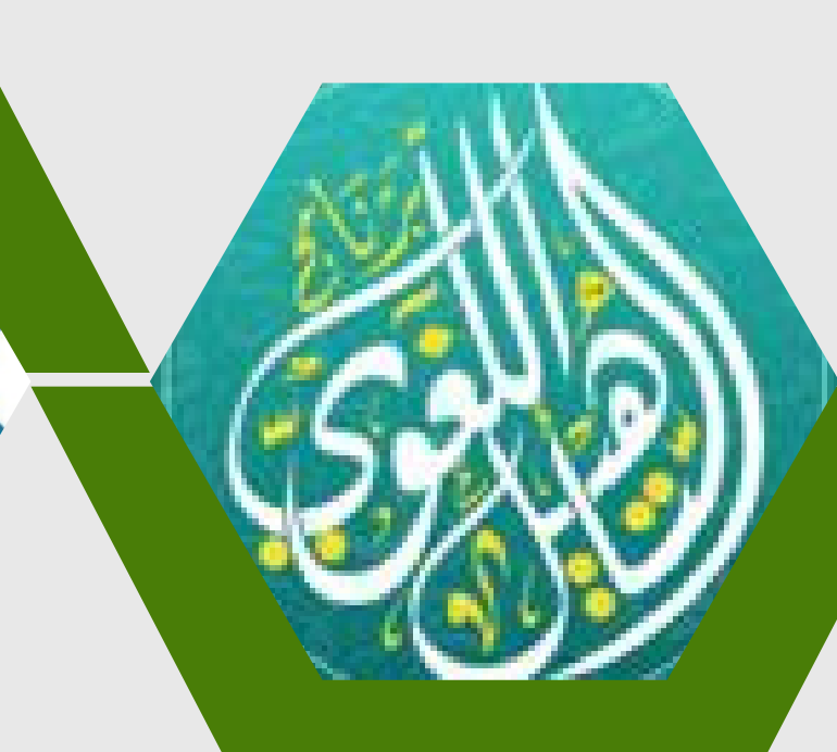
برنامج التأهيل اللغوي