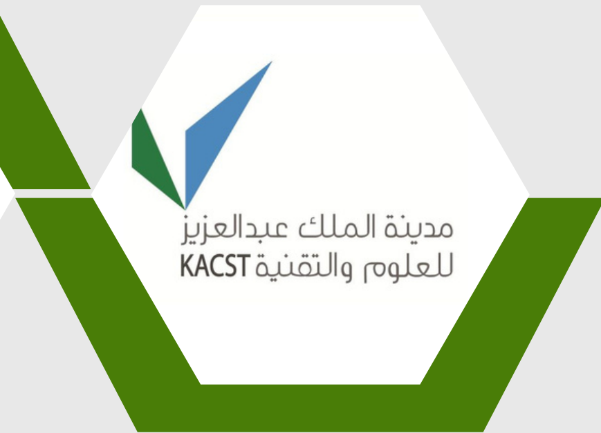
مدينة الملك عبدالعزيز للعلوم والتقنية