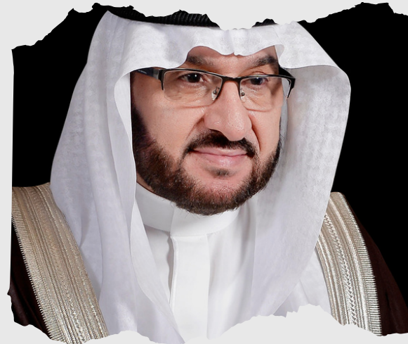
رئيس جامعة طيبة معالي الأستاذ الدكتور عبدالعزیز بن قبلان السراني