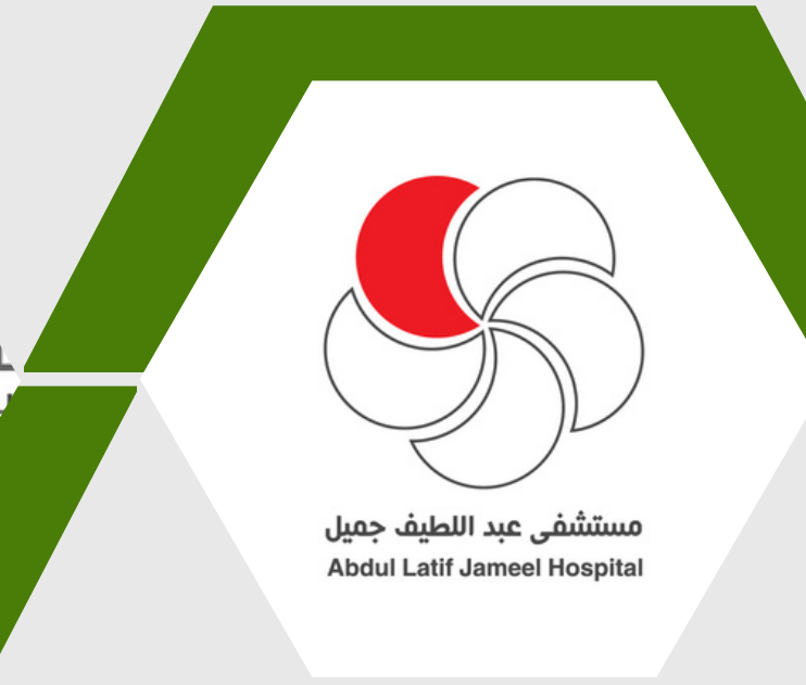
مستشفى عبد اللطيف جميل