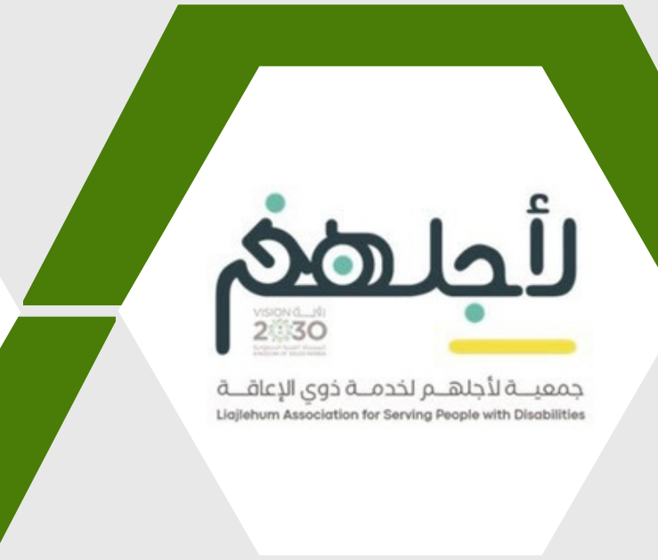
جمعية لأجلهم لخدمة ذوي الإعاقة